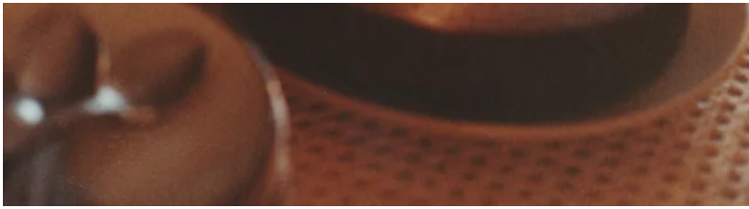
פפוט חוגג יום הולדת, 1938. מנהג עכו"ם